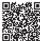
Pracoviště Domažlice na Mapy.cz

Služba je určena pro lidí z domažlického a horšovskotýnského regionu, kteří jsou občany ČR nebo EU.